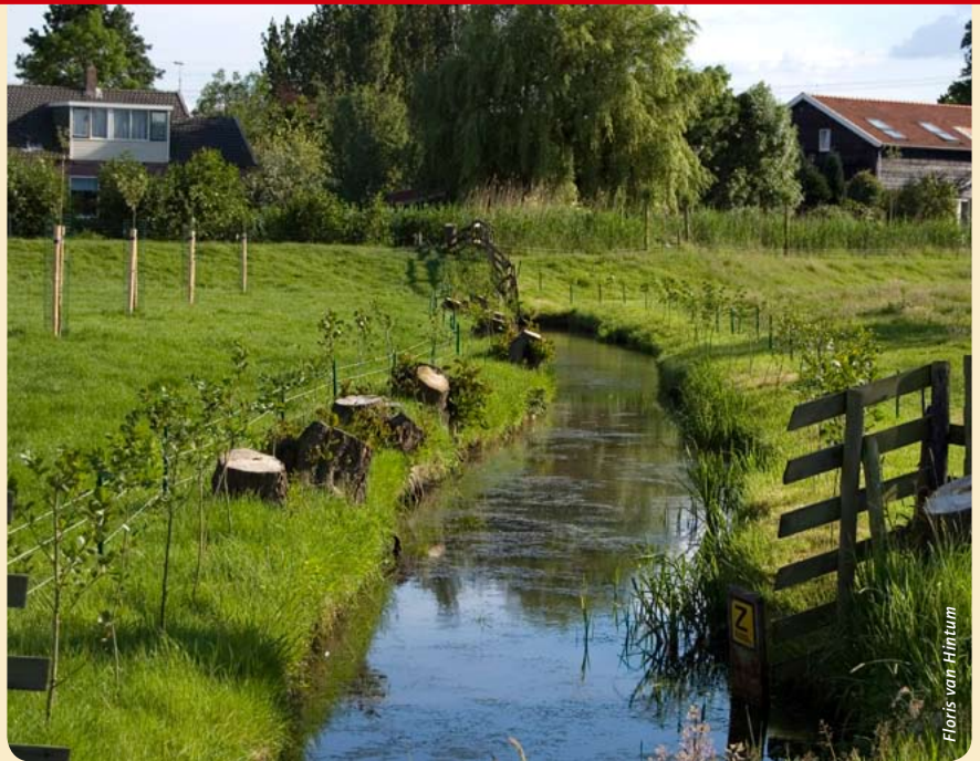
De bestaande 'doorgesloten' elzen zijn als hakhout afgezet en nieuwe elzen zijn aangeplant. Een mooie gesloten elzenhaag zal de komende jaren weer de lommerrijke bongerd omzomen.

Elzensingels waren tot een eeuw geleden een typisch Nederlands fenomeen. Vooral op de nattere zandgronden was dit landschapselement in overvloed te vinden. Maar ook op overgangen tussen grondsoorten en op veengrond trof men vele elzensingels aan. Elzensingels ontstonden spontaan op slootkanten door elzenaadjes die daar kiemden. De vroegere boeren waren blij met de op hun perceelsranden kiemende boompjes en zaagden deze periodiek af voor brandhout en gebruikshout. Bovendien zorgden de singels voor een welkome beschutting van akkers, weilanden en boomgaarden. Het hakhoutbeheer zorgde voor een relatief lage, gesloten begroeiing waarin wilde planten goed gedijen en waarin ook allerlei diersoorten een onderkomen vonden, zoals elzenhaantjes (pietepouterige kevertjes), bunzingen en ransuilen, die in de avonduren langs de elzenhagen op zoek gaan naar een geschikte prooi.