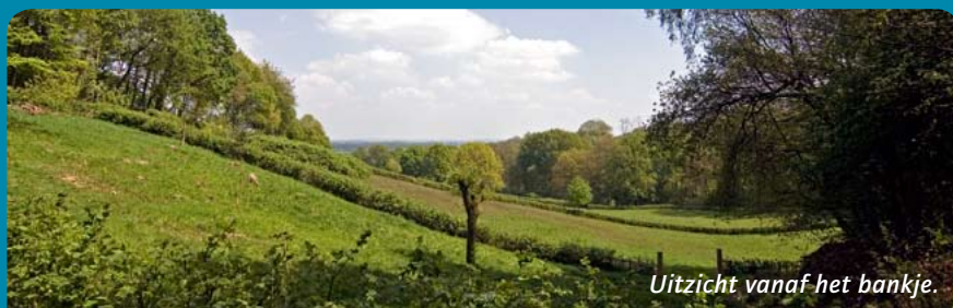
Uitzicht vanaf het bankje.